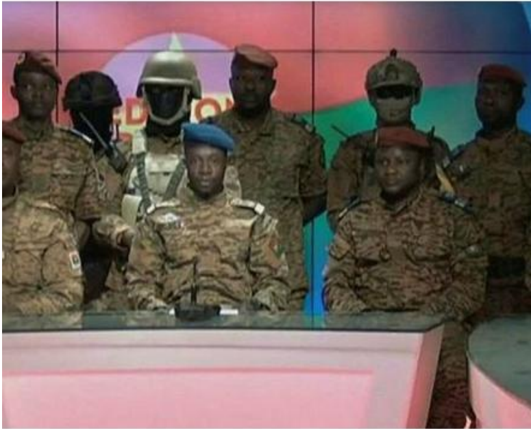
Burkina Faso coup leaders