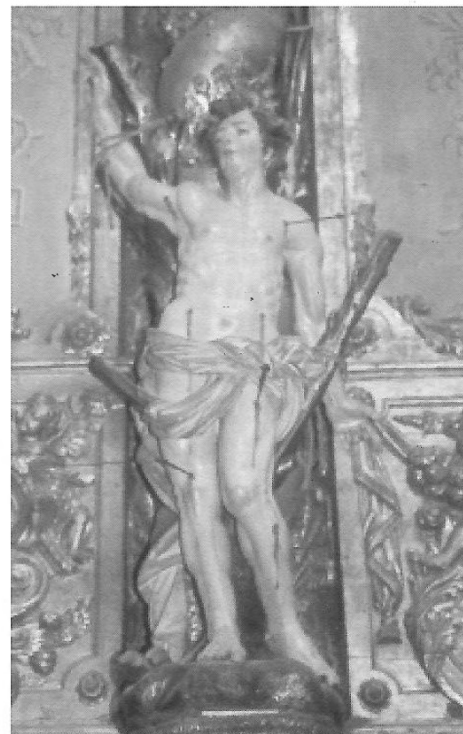
São Sebastião - Século XVIII Igreja do antigo convento de São Francisco

No Séc. XVIII constituem os principais encomendantes de imaginária religiosa os núcleos que apostaram no revestimento das suas igrejas com a solução da talha. O retábulo apresenta-se