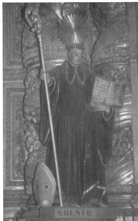
São Bento - Século XVIII Obra do escultor francês Claude Laprade. Retábulo da capela-mor da Sé Catedral do Porto

Sobre os mestres escultores que afirmaram esta escola de