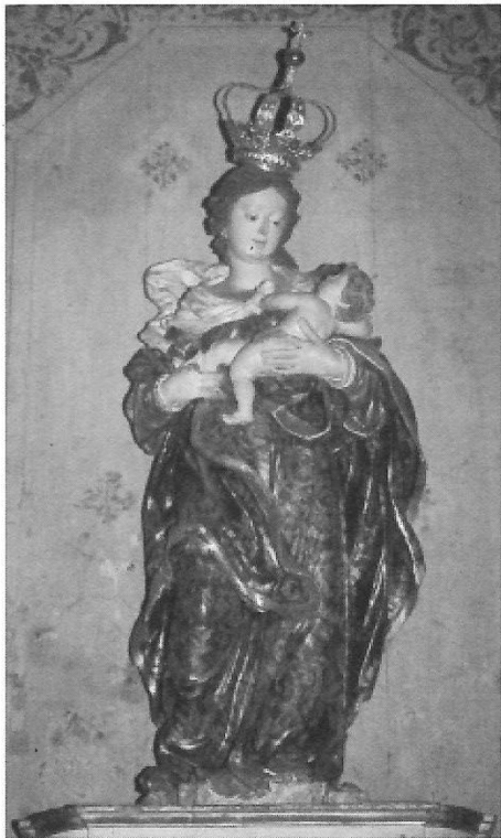
Nossa Senhora da Guia - Século XVIII Igreja do antigo mosteiro de São João Novo

O Barroco, enquanto arte cénica, encontrou na solução da talha dourada uma forma excelente de transmitir uma mensagem de grandeza, de força e de poder e ao mesmo tempo de, através da expressão luxo, persuadir e encaminhar as consciências dos fiéis católicos para comportamentos que se enquadrem nos valores que as Instituições Contrarreformistas pretendiam alcançar, privilegiando as directrizes da XXV Sessão do Concílio de Trento, adaptadas pelos Concílios Diocesanos às particularidades de cada região. Desta forma a Igreja surge-nos como o maior encomendador de obras de arte religiosas, controlando, em nome da decência, e do princípio do nihil profanum, nihil inhonestum e nihil insolitum, ao mesmo tempo os artistas e o programa iconográfico das encomendas 1 , reafirmando vincadamente a tradição do culto às imagens, cujas origens teríamos que procurar logo nos primeiros tempos do Cristianismo 2 e que em Portugal encontrámos nos programas do Românico, do Gótico, do Manuelino e dos movimentos artísticos que se seguiram.