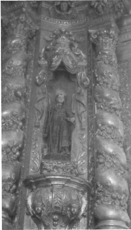
São Bento - Século XVIII Igreja Paroquial de São João da Foz, antiga igreja do mosteiro de São Bento

5. BRANDÃO, Domingos de Pinho. Obra de talha dourada ensamblagem e pintura na cidade e na diocese do Porto . Porto: Diocese do Porto, 1986. p. 118. v. III.