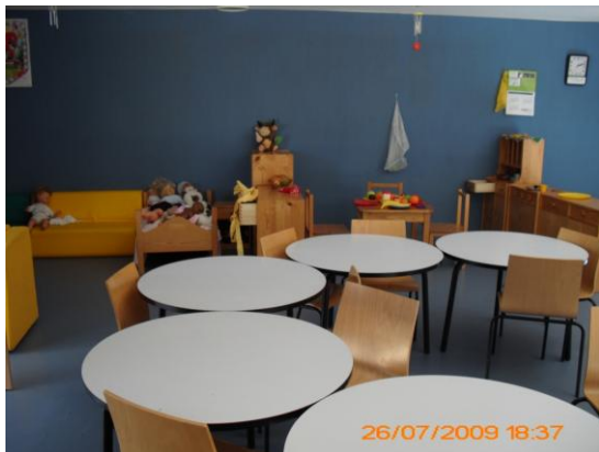
FOTO 43 - ESPAÇO DO JARDIM