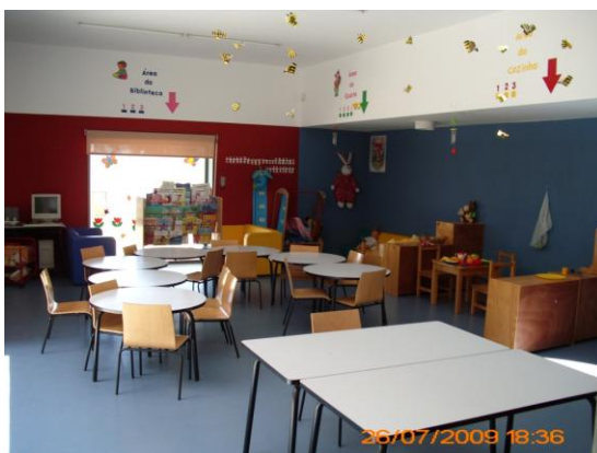
FOTO 45 - ESPAÇO JARDIM INFÂNCIA