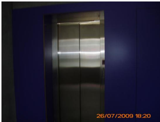
FOTO 41 - ELEVADOR