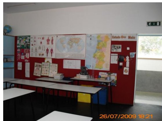
FOTO 52 - SALA DE AULA