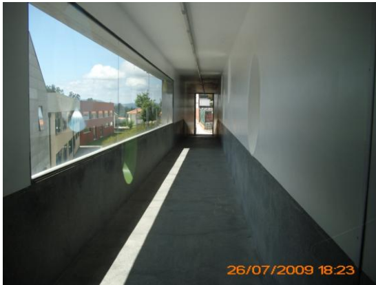
FOTO 39 - CORREDOR