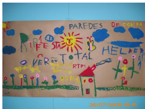
FOTO 46 - PAINEL CORREDOR