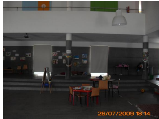
FOTO 48 - POLIVALENTE