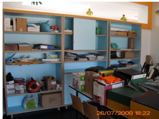
FOTO 42 - ESPAÇO DE TRABALHO