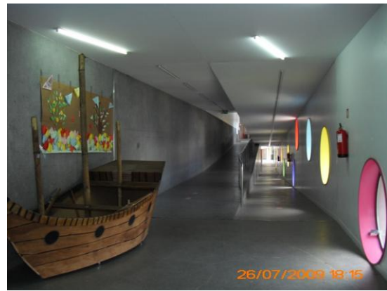
FOTO 40 - CORREDOR