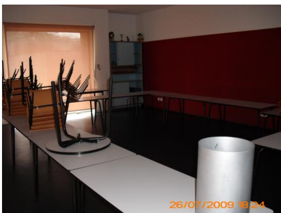
FOTO 53 - SALA DE AULA