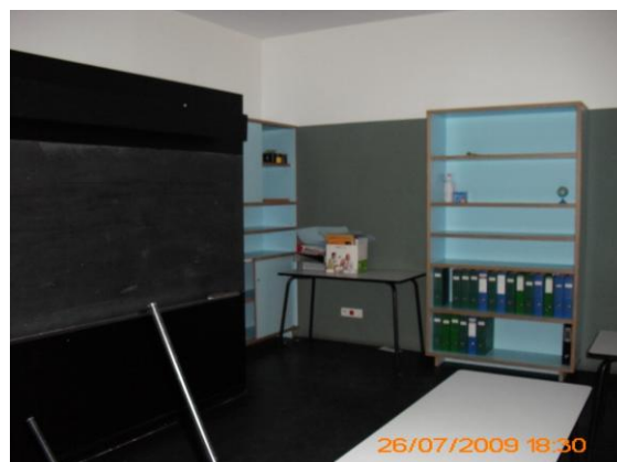
FOTO 54 - SALA DE AULA