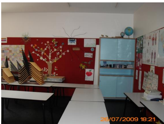
FOTO 51 - SALA DE AULA