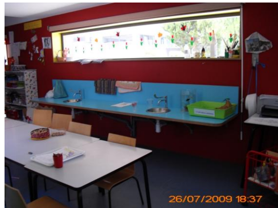
FOTO 44 - ESPAÇO JARDIM INFÂNCIA