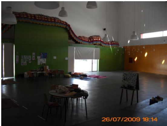
FOTO 47 - POLIVALENTE