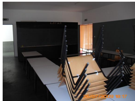
FOTO 50 - SALA DE AULA