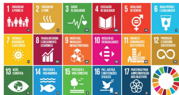
Figura 1: Número de publicações por ODS no Repositório Institucional UPT.

Consulte as publicações relacionadas com os Objetivos de Desenvolvimento Sustentável