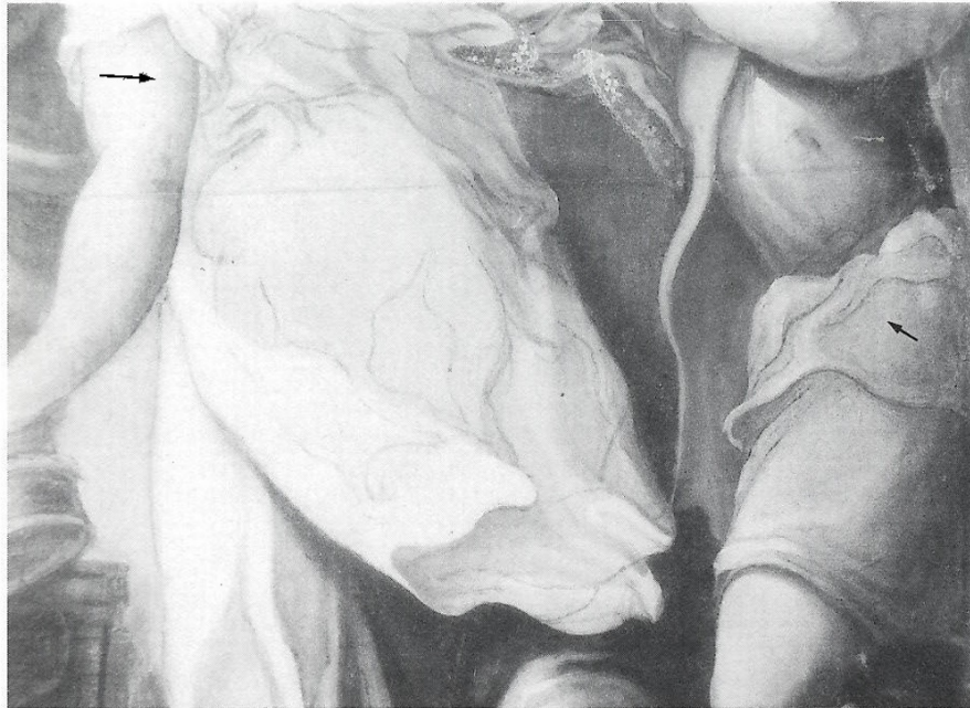
7. Criada da direita. Santa Ceia – Casa do Caraça . Infravermelho. Notam-se linhas do esboço não acompanhadas pela pintura.