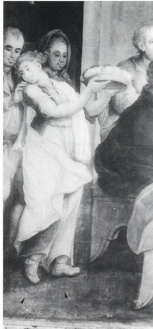
8. Criada da esquerda. Santa Ceia – Casa do Caraça. Fotografia normal, vendo-se por uma transparência: linhas de dobras do panejamento e arrependimento do artista – pés esquerdo e direito.