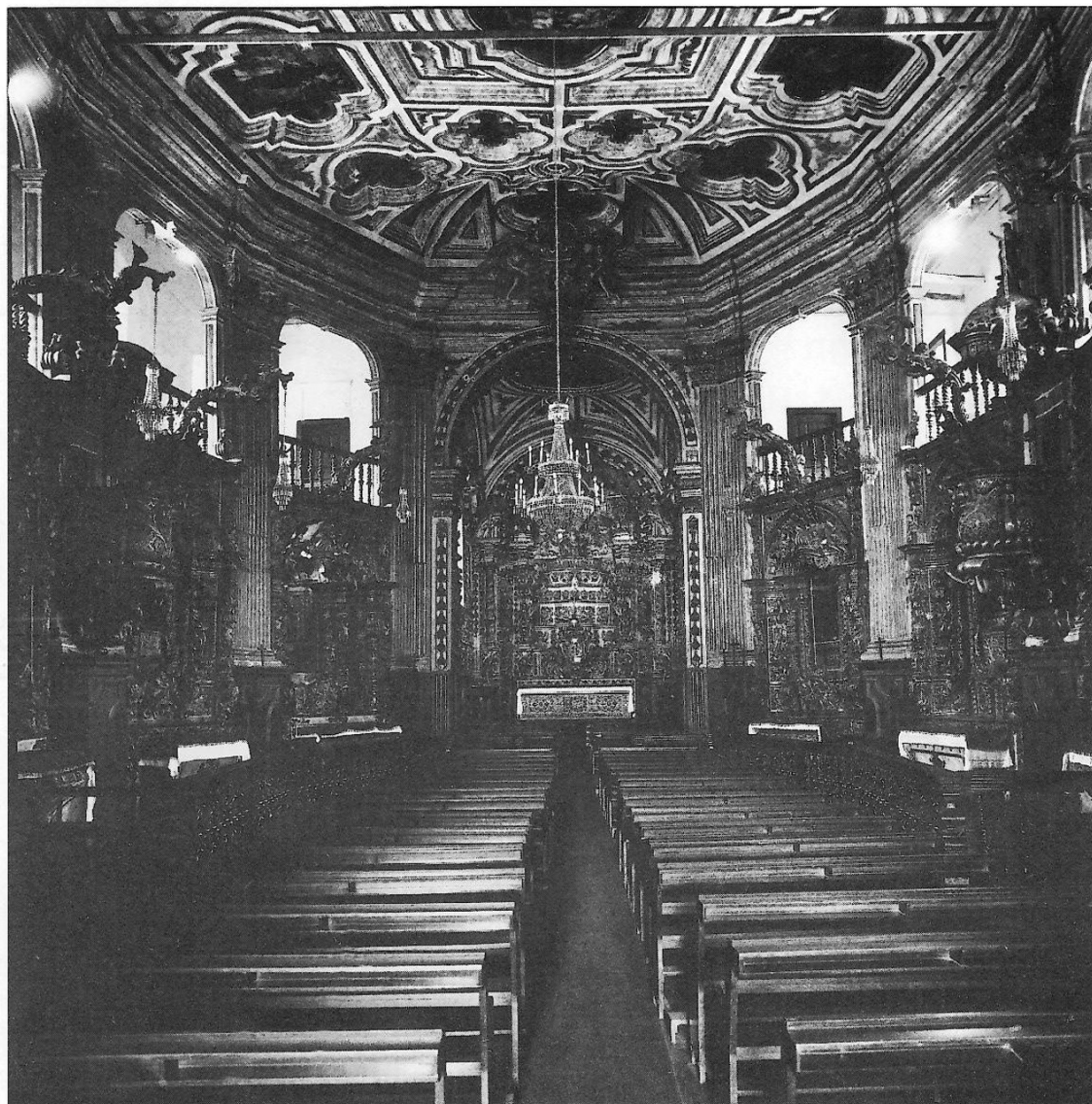
1. Ouro Preto – Matriz de Nossa Senhora do Pilar – Nave elíptica – “Destinou-se para este lúgubre aparato e celebração das exéquias a Igreja de Nossa Senhora do Pilar de Ouro Preto, freguesia a mais antiga das duas desta villa. He este templo de figura ovada por dentro, com 3 altares colateraes de cada lado, adornado todo com sua perfeição. Tem da porta principal athé o arco do coro 22 palmos de comprido e deste arco athé ao do Cruseyro ou capela-mor 88; de largo 55 e de altura do pavimento athé o tecto 58”. Trata-se (1751) talvez da mais antiga referência documental ao singular interior da Matriz do Pilar de Ouro Preto (Cf. “Breve descripção ...” localizada pelo historiador José Manuel Tedim.)