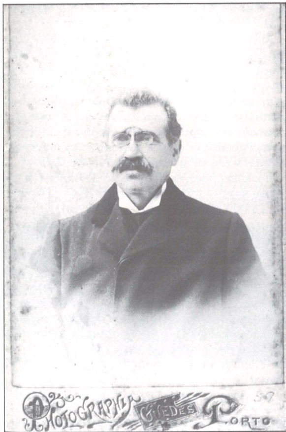
SENADOR SOUSA FERNANDES

Pela terceira vez, comemorava-se em todo o país a instauração do novo regime, sonho realizado de muitos que ansiavam ver Portugal libertado das teias da monarquia em decadência e caminhar de uma vez por todas no sentido do progresso e do desenvolvimento. Era o dia 5 de Outubro de 1913 e, em Vila Nova de Famalicão, as comemorações da República assumiam um carácter especial com a inauguração, numa atitude simbólica que ligava a cultura à revolução, da Biblioteca Municipal. Não era de estranhar tal atitude: o mesmo grupo de homens que, nos finais do século de oitocentos e ao longo do decénio seguinte assumira a liderança da oposição republicana na pequena vila de Famalicão, detinha agora a liderança política do concelho. Na senda das preocupações culturais que haviam marcado a sua actuação nos tempos da monarquia (não esqueçamos que o senador Sousa Fernandes, primeiro Presidente da Câmara da República e director