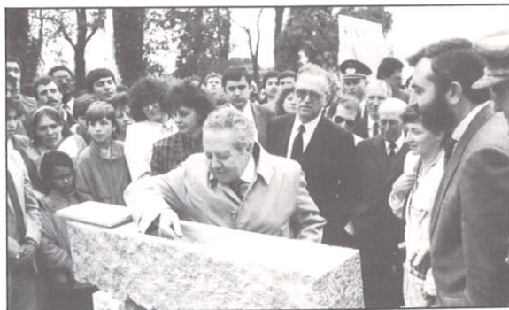
COLOCAÇÃO DA 1.ª PEDRA DO NOVO EDIFÍCIO — 88 / 5 / 31

bibliotecas, culmina com a celebração de um contrato-programa com o I.P.L.L. (Instituto Português do Livro e da Leitura) para a construção de um novo edifício, de acordo com a concepção da biblioteca como agente imprescindível do desenvolvimento cultural e da democracia, veiculada pela UNESCO (11) e assumida por aquele Instituto (12) no programa de criação de uma Rede Nacional de Leitura Pública.