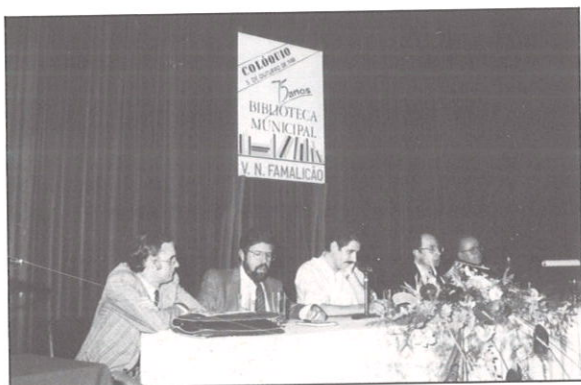
COLÓQUIO COMEMORATIVO DO 75.º ANIVERSÁRIO DA BIBLIOTECA MUNICIPAL

No ano seguinte, comemoravam-se os 75 anos da Biblioteca Municipal. Três quartos de século após a sua inauguração, a Biblioteca Municipal de V. N. de Famalicão realizava o sonho dourado de uma geração que acreditava na Biblioteca como centro difusor da cultura e da educação, da informação e do lazer. Uma exposição documental sobre os 75 anos da Biblioteca, um colóquio versando temas tão candentes como “A Cooperação Inter-Bibliotecas” e “A Democracia e a Leitura Pública” assinalaram o dia da celebração, estando as comunicações a cargo de personalidades de relevo da vida política e cultural do país e ainda do presidente da Cooperação Francesa Inter-Bibliotecas, M. Cecil Guitart. O debate animado que se seguiu é ponto de partida para uma reflexão fundamental sobre questões tão essenciais à democracia como a promoção da cultura e da liberdade de pensamento através do acesso livre a todos os suportes de informação. As várias perspectivas, oriundas dos diversos quadrantes políticos dos intervenientes neste colóquio são bem exemplo do espírito livre e inquieto que rege as bibliotecas, enquanto agentes privilegiados da sociedade democrática.