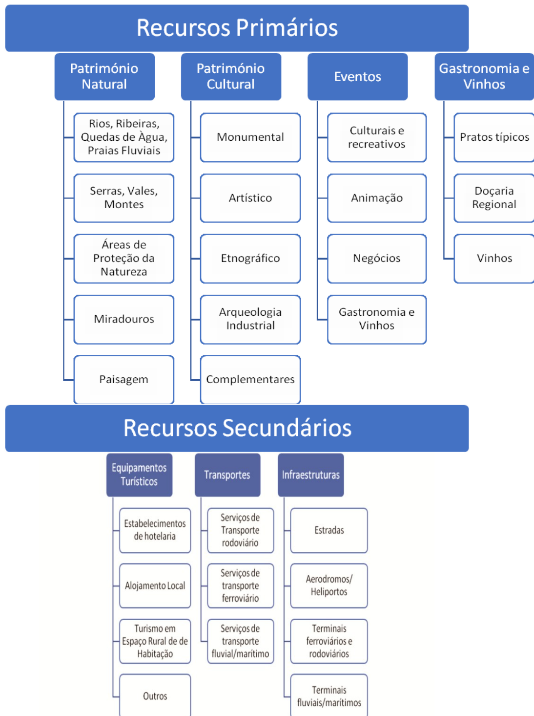
Figura 2 – Elementos da matriz de recursos