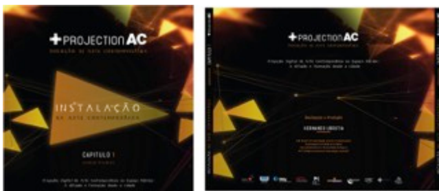
Figura 1: Imagem da capa e contracapa do DVD do vídeo piloto [“Instalação na Arte Contemporânea” - Capítulo 1]

Com base na demarcação da conceção do artefacto na arte contemporânea, foi escolhido previamente para a realização do vídeo piloto o tema “Instalação na arte contemporânea”, por ser um dos temas mais explorados que engloba a maior quantidade de possibilidades da arte contemporânea. Para tal, realizou-se um trabalho de investigação onde se propõe uma plataforma de trabalho inicial, na qual se executa um esquema base com os seguintes pontos a desenvolver: 1) O que é a instalação; 2) Contextualização e Abordagens; 3) A Instalação como Arte In Situ ; 4) A instalação como Arte Conceptual; 5) História da Instalação, Seus Primórdios; 6) O criador da Instalação; 7) A primeira Instalação; 8) Diferença entre Escultura e Instalação; 9) Diferentes tipos de Instalações; 10) Instalação como Intervenção no Espaço Público. Realizando uma síntese de conteúdos na língua portuguesa, já que a instalação inaugural se localizou em território português.