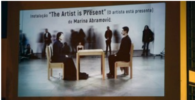
Figura 6: vídeo projeção do Artefacto ["Instalação na Arte Contemporânea" - Capítulo 1]

abordagem que cada cidadão tem na sua relação a contextos específicos ser de natureza muito individual e que obedece às suas possibilidades de tempo, disposição e seus próprios interesses e desejos.