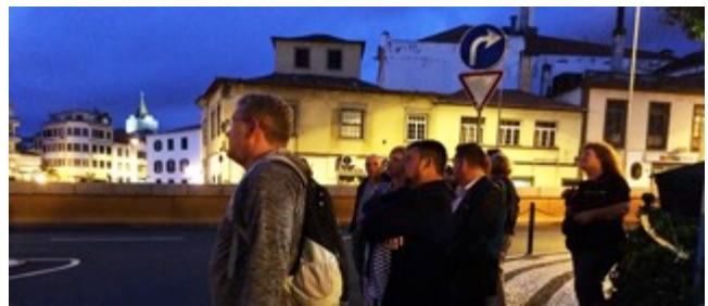
Figura 3: Cidadãos apreciando o Artefacto ["Instalação na Arte Contemporânea" - Capítulo 1] no espaço público.

As reflexões de que cada indivíduo, que se torna um participante real de uma cidade, leva-o a ser parte do desenvolvimento e experiências da sua comunidade na cidade, em que se encontra integrado. No entanto, face ao desenvolvimento acelerado da sociedade contemporânea leva a que muitas vezes as pessoas comuns que não tenham acesso aos novos paradigmas que a mesma contemporaneidade apresenta, fiquem arredados ou distanciados do mesmo, estabelecendo-se assim uma lacuna que não permite o contacto e assimilação dos novos paradigmas, novos conceitos e desenvolvimentos pelo cidadão comum. O artefacto "+Projection AC" ambiciona encontrar formas de ajudar a preencher essa lacuna.