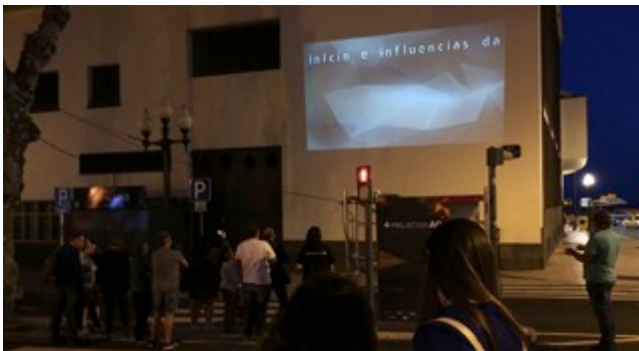
Figura 4: Implementação do Artefacto ["Instalação na Arte Contemporânea" - Capítulo 1] no espaço público.

É importante refletir sobre a democracia na cidade por se tratar de um tema de reflexão que se desdobra e expõe como necessário, para os indivíduos que habitam uma cidade, onde devemos considerar as suas necessidades. Precisamos pensar onde nas cidades poderemos ouvir o pulso da vida urbana contemporânea e transformá-lo em corpos de democratização do conhecimento dos seus cidadãos, em implantações de pensar e novas abordagens para a contemporaneidade, na base da cidadania participativa, retornando à democracia e às suas origens, base fundamental da democracia de participação efetiva.