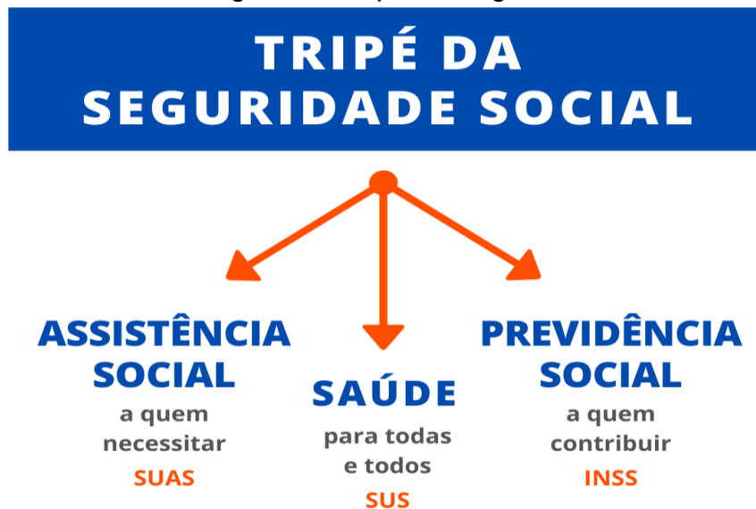
Figura 1 – Tripé da Seguridade Social