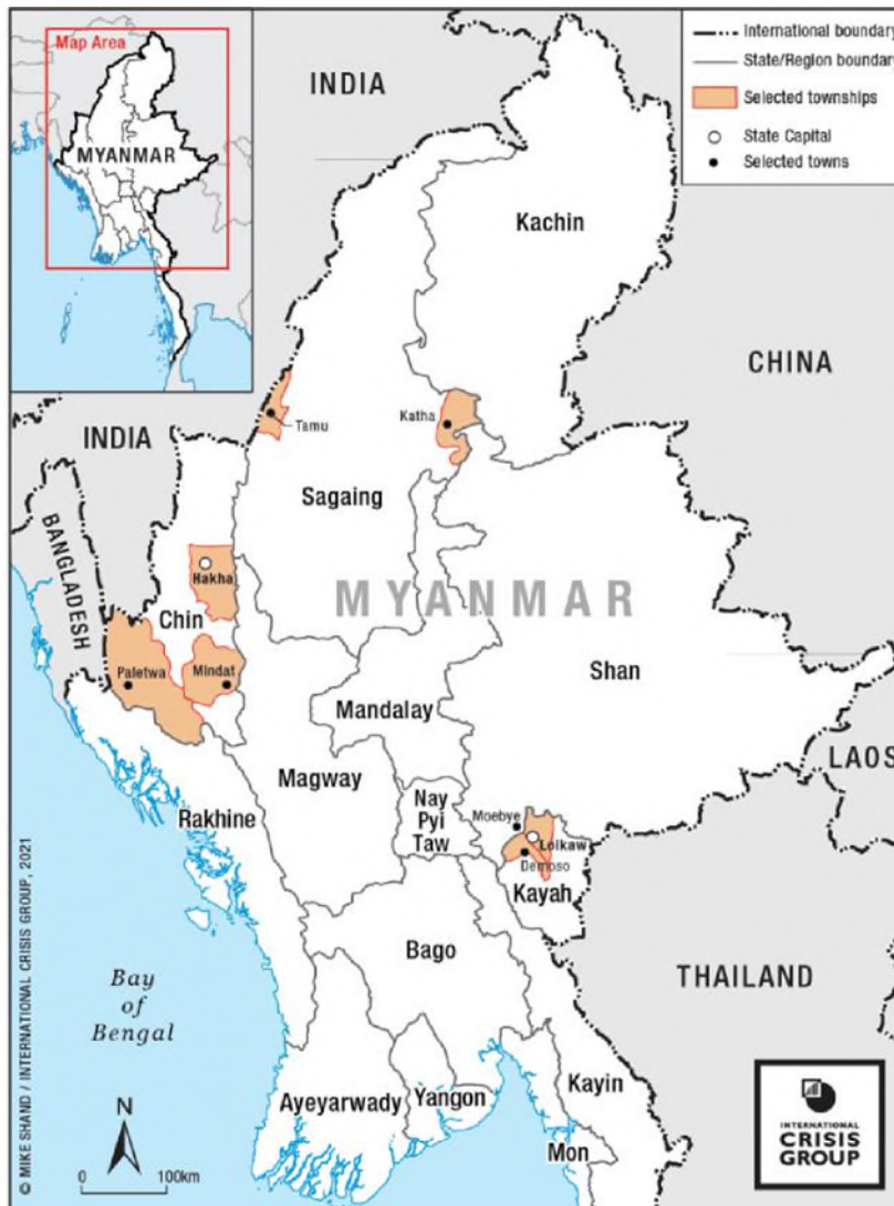
Fig1: Mapa de Myanmar. Fonte: International Crisis Group:

https://www.crisisgroup.org/asia/south-east-asia/myanmar/b168-taking-aim-tatmadaw-new-armed-resistance-myanmars-coup