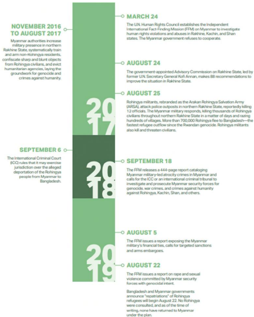
Figura 3: Cronologia de eventos da Lei da Cidadania.