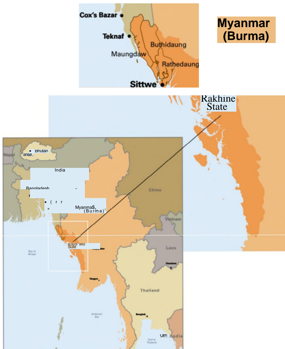
Figura 2: Mapa do Estado de Rakhine.