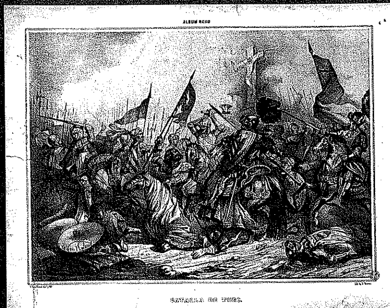
Batalha de Toro, gravura do século XIX.