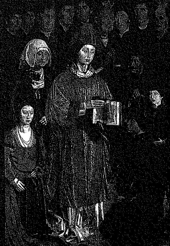
D. Joana casou com o tio, D. Afonso V (de vermelho na foto), rei de Portugal, viúvo de D. Isabel, filha do infante D. Pedro. Painel do Infante D. Pedro, Políptico de São Vicente. [MUSEU NACIONAL DE ARTE ANTIGA]