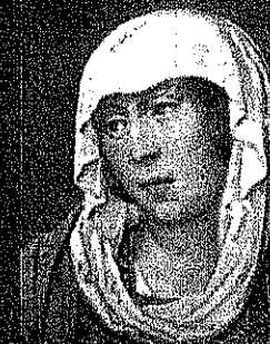
D. Joana ficou conhecida em Portugal como a Excelente Senhora e, em Castela, como La Beltraneja.