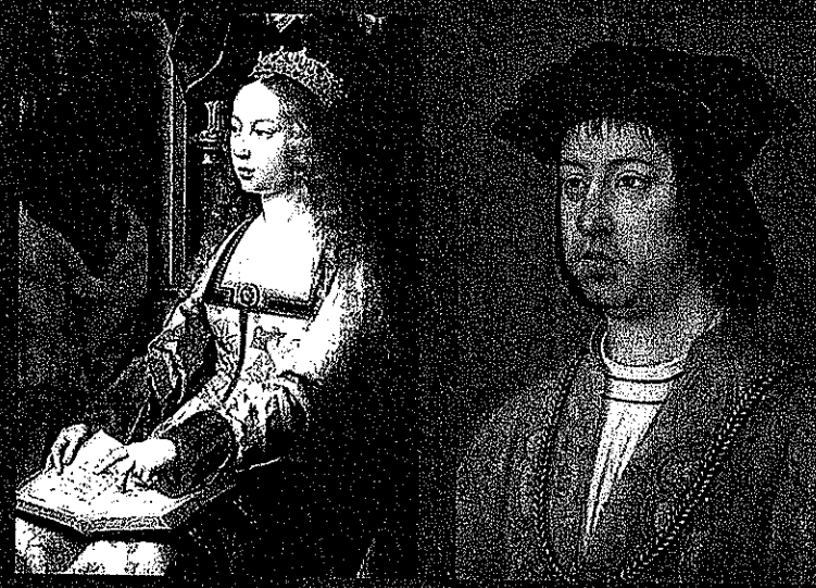
Isabel de Castela e Fernando de Aragão, conhecidos como Reis Católicos.