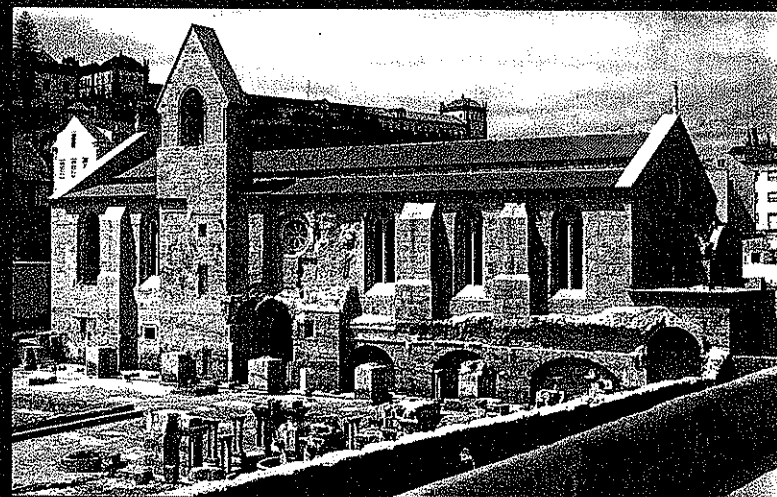
D. Joana entrou inicialmente no Mosteiro de Santa Clara de Santarém (primeira foto). Mais tarde, transferiu-se para o Mosteiro da mesma Ordem em Coimbra (segunda foto). Ali se manteve afastada da política peninsular, conforme pretendiam os Reis Católicos.