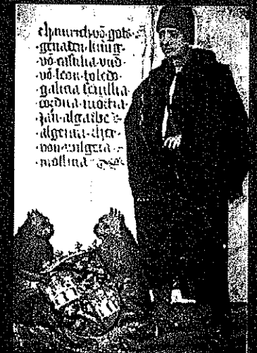
D. Joana foi a única filha de Joana de Portugal e do rei Henrique IV de Castela (na foto).