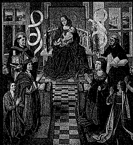
Fernando, o Católico, com o seu herdeiro, João de Aragão e Castela à esquerda e Isabel I de Castela, à direita. Madonna dos Reis Católicos, Pintura de 1490-95.