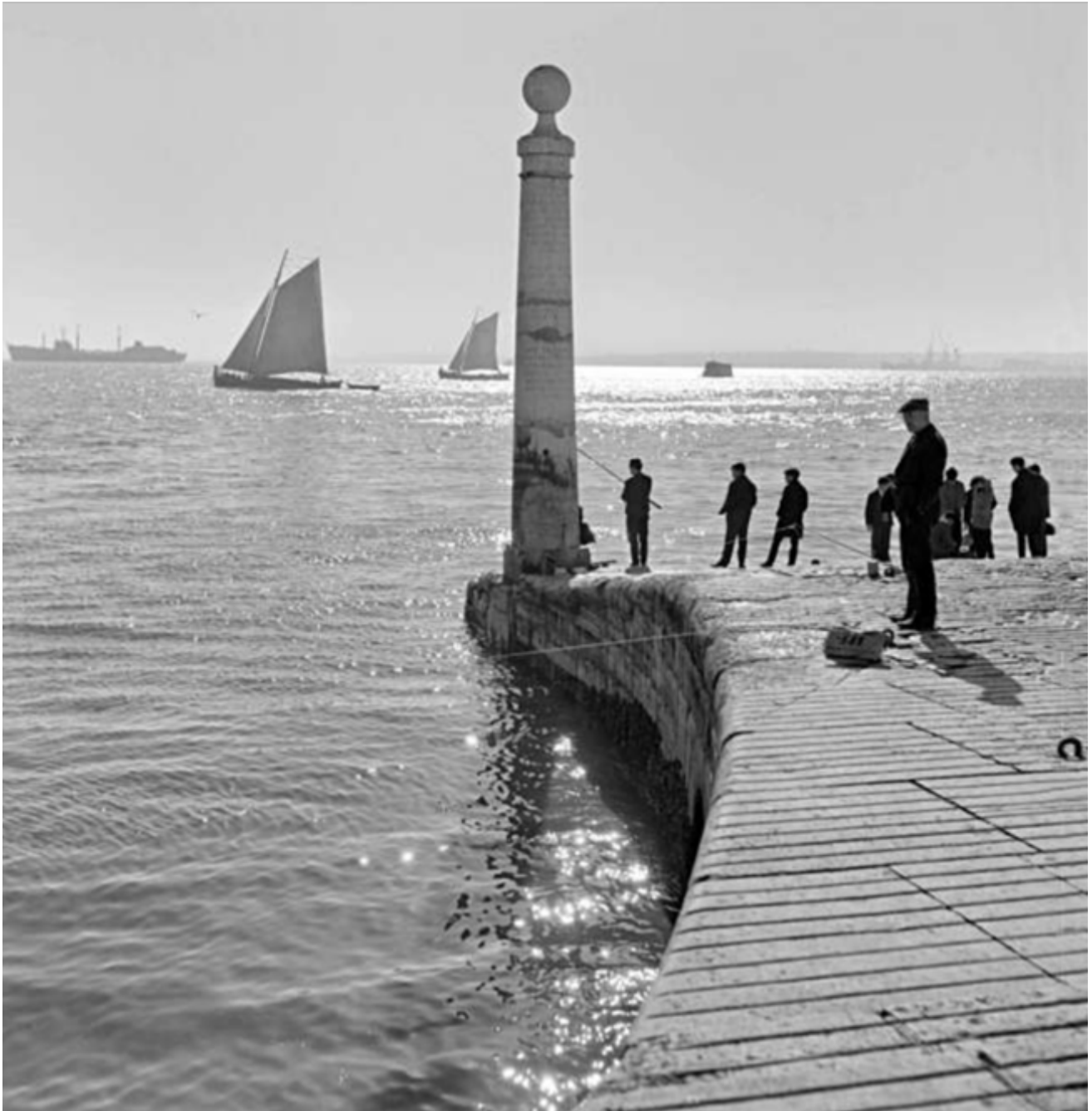
Fig. 01- Cais das Colunas, Lisboa (1960-1980)