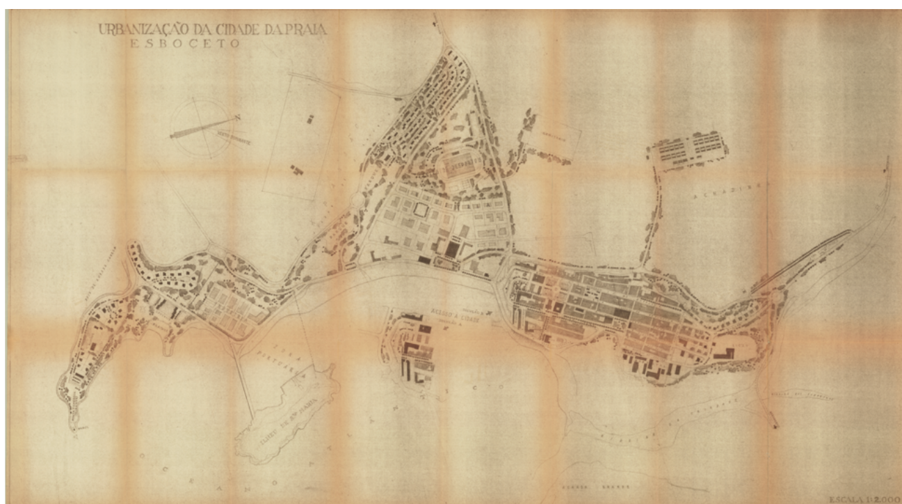
Fig. 13 - Esboço da Urbanização da Cidade da Praia, 1957-59. João António Aguiar.

A situação da cidade da Praia parte de um pressuposto topográfico muito singular, caracterizado por pequenos planaltos separados por acentuados talvegues. A apropriação progressiva da ilha com a ocupação preferencial dos planaltos, as achadas, contribui para fragmentação da Cidade em núcleos isolados. Neste caso específico, ao contrário das congéneres africanas onde a indústria constitui um condicionante pré-existente, é o próprio plano que determina a sua localização como estímulo programático do território.