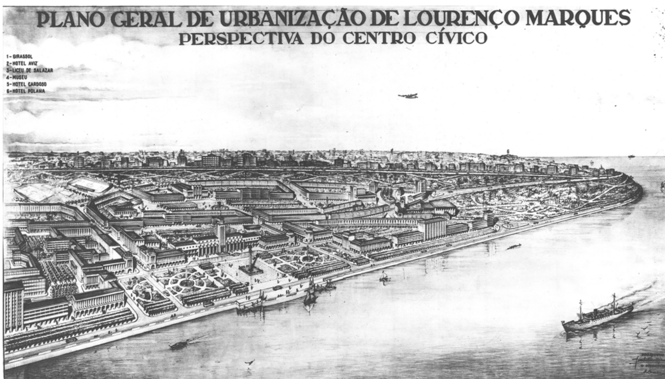
Fig. 11 - Plano Geral de Urbanização de Lourenço Marques, perspetiva do centro Cívico, 1956. João António Aguiar.