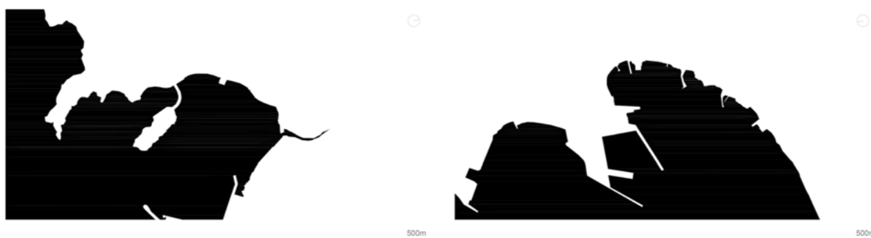
Fig. 12- A baía das cidades da Praia e do Mindelo, em Cabo Verde. Criação própria

Os processos relativos a Cabo Verde surgem na reta final da preponderância do GUU e na alteração do ímpeto produtivo do próprio João Aguiar (Milheiro, 2012). Quer a Praia, quer o Mindelo, apesar das diferenças geográficas, topográficas e administrativas foram abordadas, tal como se observa nos esboços realizados,