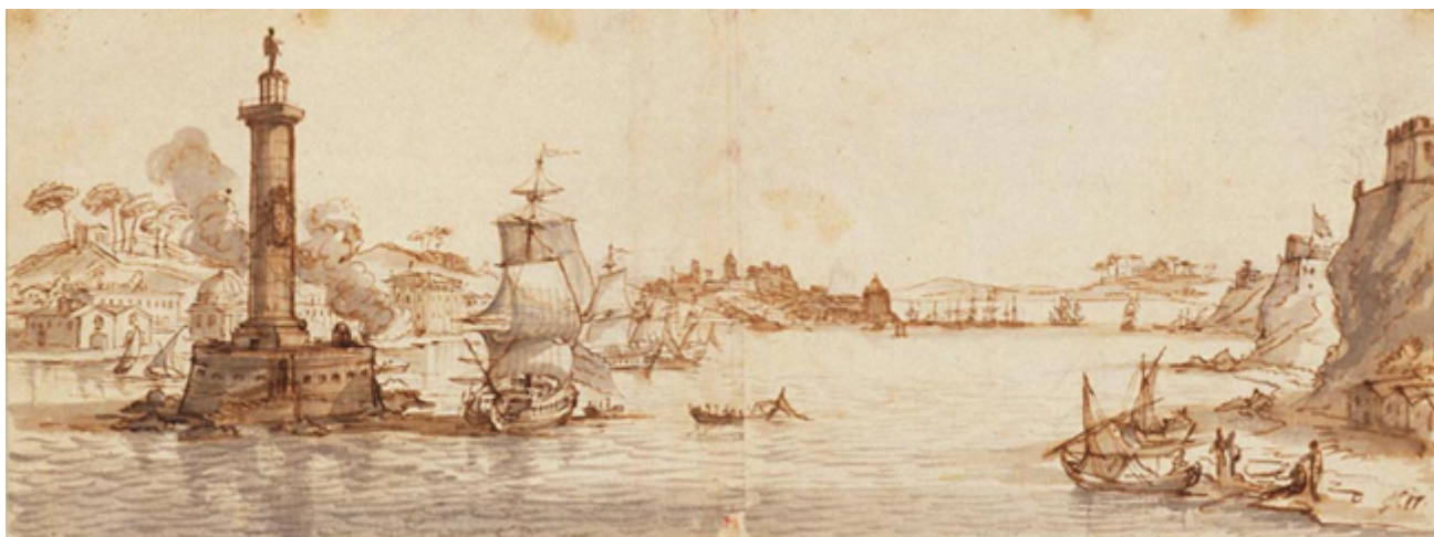
Fig. 02 - Desenho da chegada a Lisboa pelo Tejo, Filippo Juvarra.