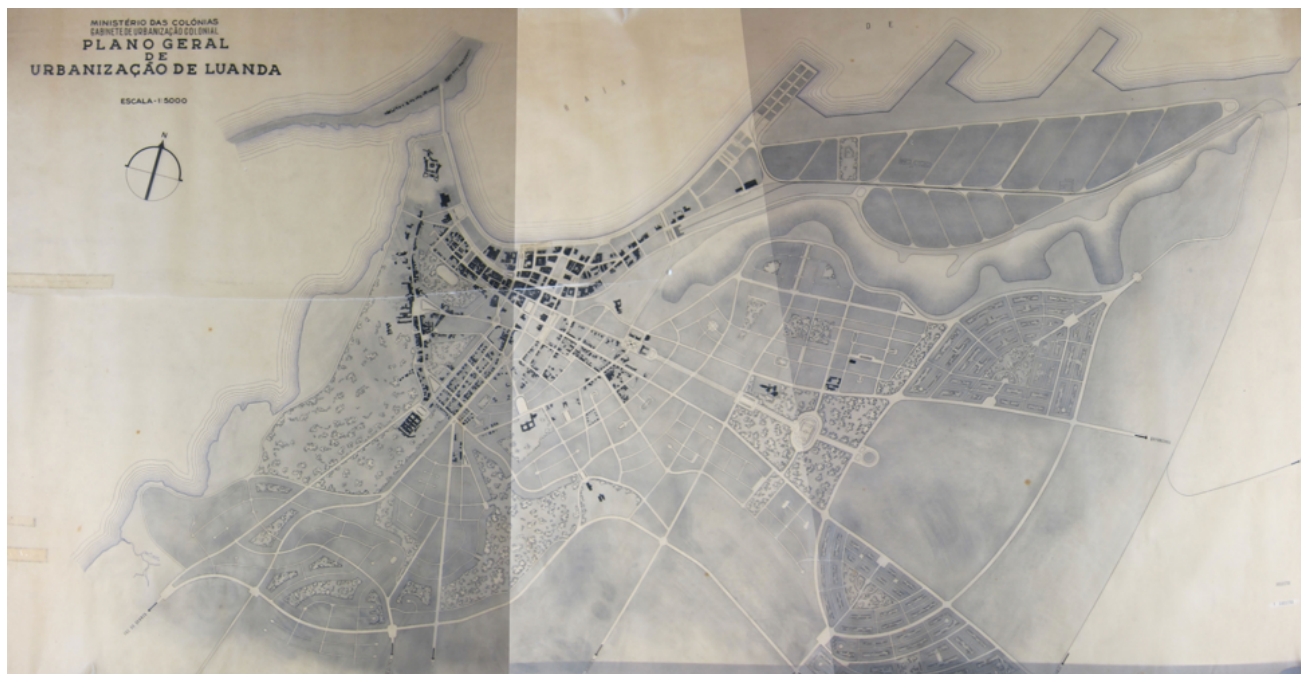
Fig. 08 - Plano Geral de Urbanização de Luanda, 1946. João António Aguiar. Fonte: Malheiro, 2018. p.545. Espólio pessoal da arquitecta Joana Bastos Malheiro