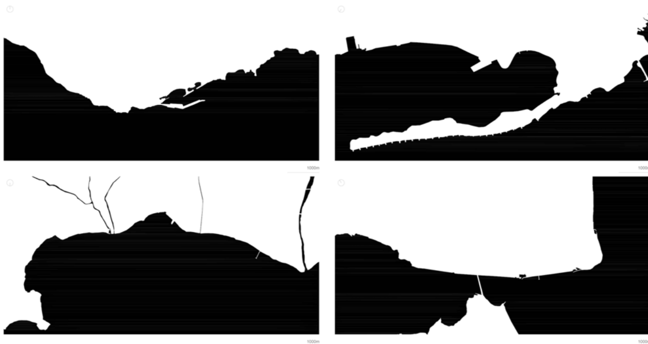
Fig. 04 - A baía das cidades de Ponta Delgada, Luanda, Dili e Maputo (Lourenço Marques)