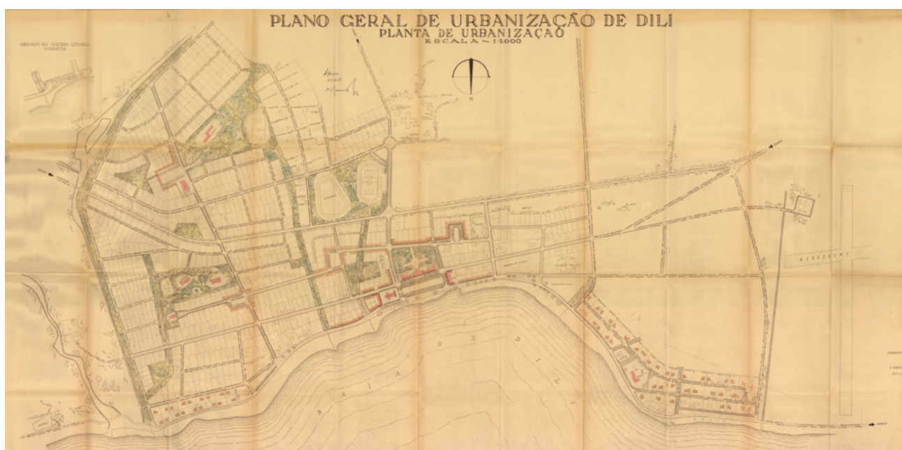
Fig.09 - Plano Geral de Urbanização de Dili, 1951. João António Aguiar.