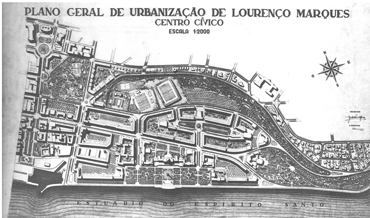
Fig. 10 - Plano Geral de Urbanização de Lourenço Marques, Planta do Centro Cívico, 1956. João António Aguiar.