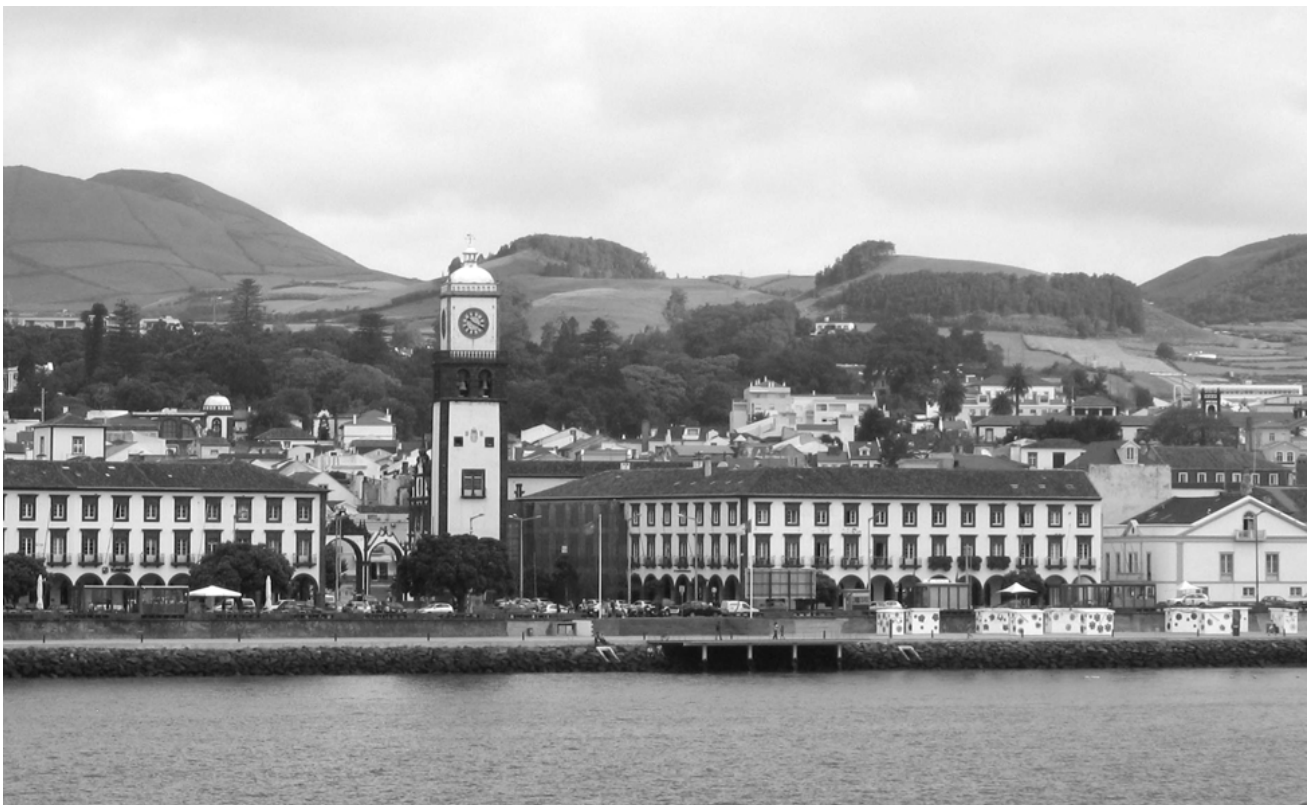
Fig. 06- Fotografia da Marginal de Ponta Delgada.