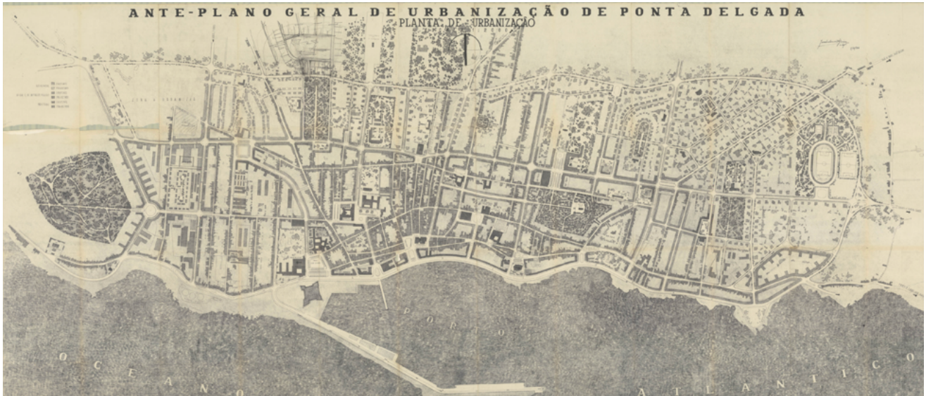
Fig. 05 - Ante-Plano Geral de Urbanização de Ponta Delgada, 1946. João António Aguiar. Fonte: Malheiro, 2018. p.285. Espólio pessoal da arquitecta Joana Bastos Malheiro