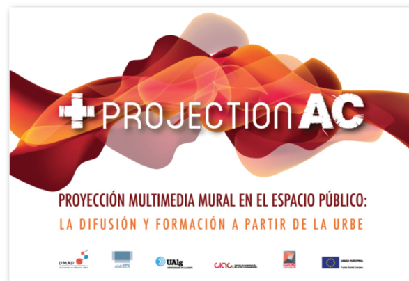
Fig. 3 Imagen inicial de la implementación del Artefacto en el programa "+ Projection AC", de la Proyección multimedia mural en el espacio público.