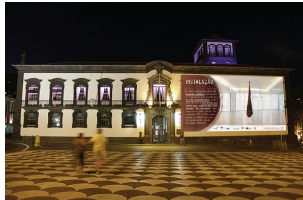
Fig. 2 proyección del Artefacto sobre la estructura arquitectónica de la urbe (Cámara Municipal de la ciudad de Funchal).