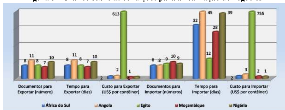
Figura 3 - Gráfico sobre as condições para a realização de negócios