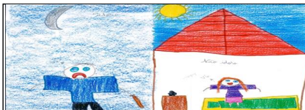
Figura 2 - Desenho ilustrativo do ambiente emocional entre a pessoa idosa e o não idoso.