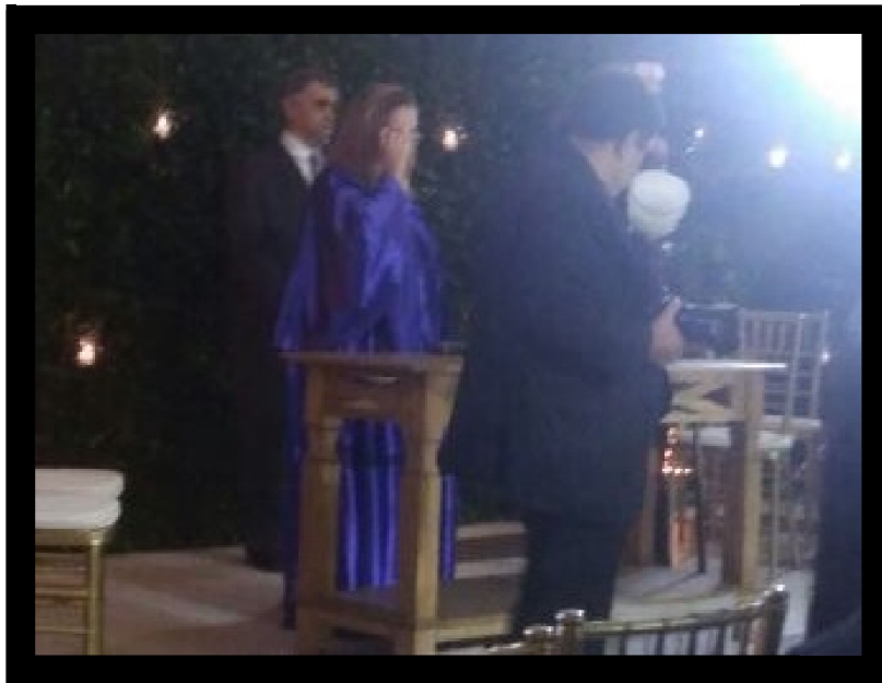
[Figura 6] – Cerimônia de casamento civil realizada fora do Cartório.