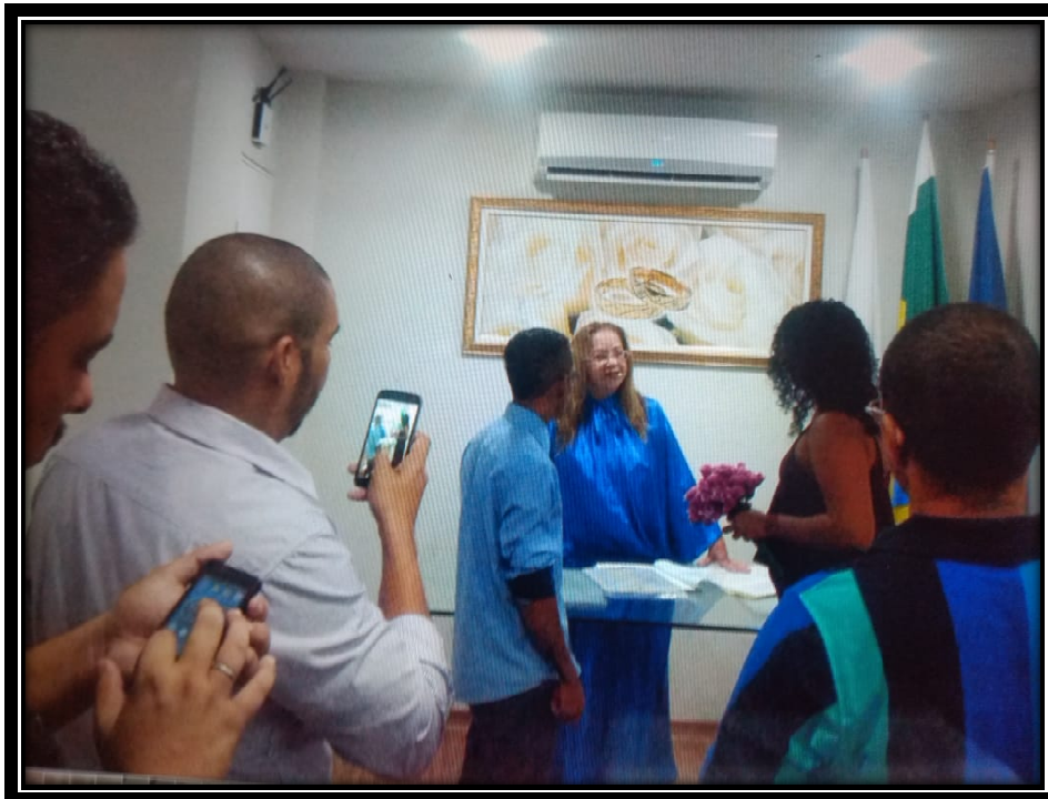
[Figura 4] - Cerimônia de casamento civil – união homoafetiva