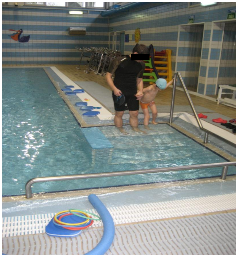
Fotografia n.º 4 – Reconhecimento do Espaço

O sistema auditivo permite localizar e detectar obstáculos bem como identificar pessoas e objectos.