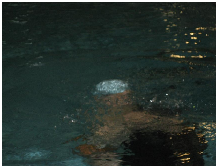
Fotografia n.º 5 – Imersão da cabeça na água