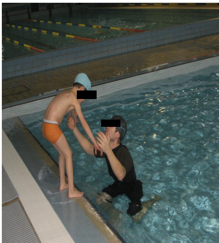
Fotografia n.º 6 – Saltar para a água de pés