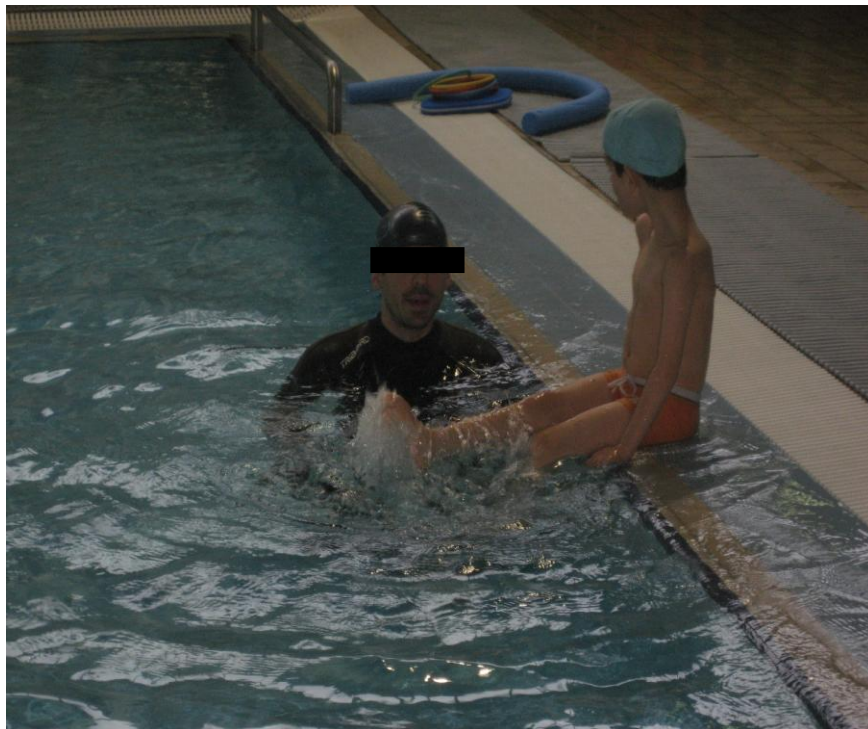
Fotografia n.º 8 – Batimentos de pernas

Nesta fase, tal como no batimento de pernas de crawl, a atenção do professor é para orientar o aluno para que este não perca a sua localização espacial de direcção e sentido.