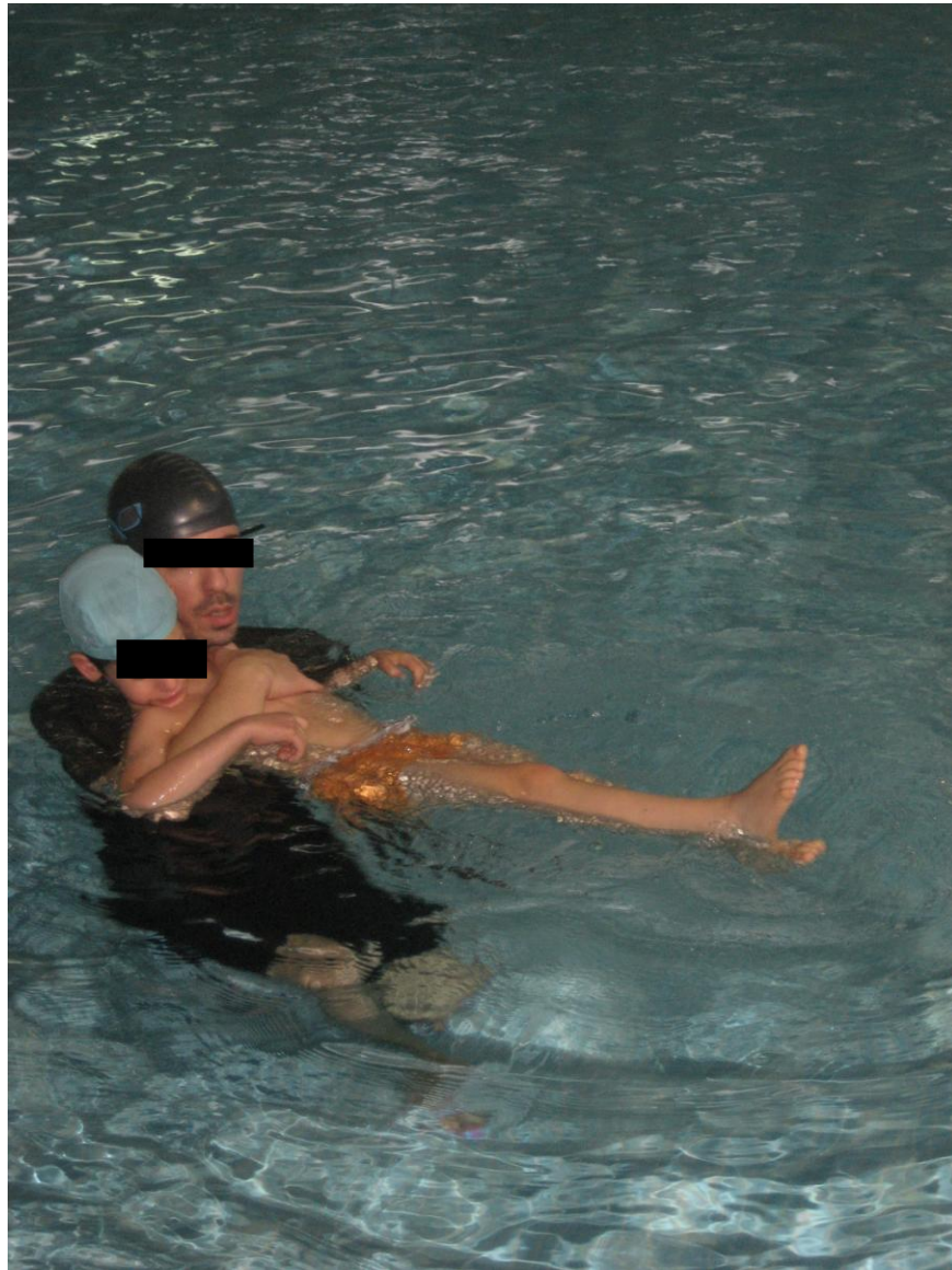
Fotografia n.º 7 – Posição dorsal