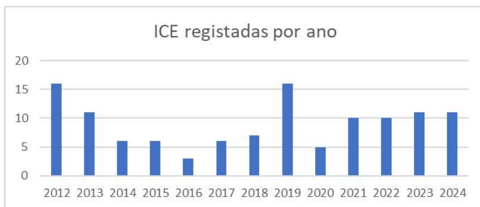
GRÁFICO 1. Apresentação das ICE registadas em 2024, com as fontes digitais necessárias, (Barata, M. S. & Alves, D. R., s.d.)

Fonte: https://europa.eu/citizens-initiative/find-initiative_en?CATEGORY%5B0%5D=any&SECTION=ALL presente em Silva, M. M. M., & Alves, D. R., 2023.